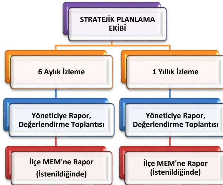
Şekil 2 Stratejik Plan İzleme ve Değerlendirme Modeli

Müdürlüğümüzün 2024-2028 Stratejik Planı İzleme ve Değerlendirme sürecini ifade eden İzleme ve Değerlendirme Modeli hazırlanmıştır. Okulumuzun Stratejik Plan İzleme-Değerlendirme çalışmaları eğitim-öğretim yılı çalışma takvimi de dikkate alınarak 6 aylık ve 1 yıllık sürelerde gerçekleştirilecektir. 6 aylık sürelerde Okul Müdürüne rapor hazırlanacak ve değerlendirme toplantısı düzenlenecektir. İzleme-değerlendirme raporu, istenildiğinde İlçe Milli Eğitim Müdürlüğüne gönderilecektir.